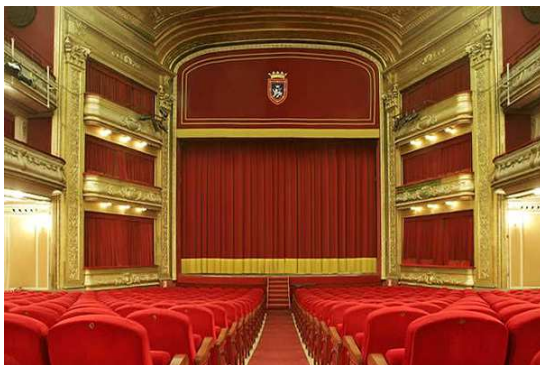
Este es el Teatro Gayarre

El Parlamento de Navarra tiene algo más de 11.000 metros cuadrados. La superficie del Parlamento de Navarra es parecida al tamaño del Teatro Gayarre.