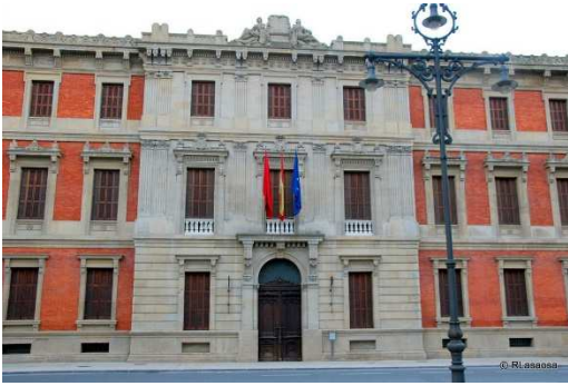
Este es el Parlamento de Navarra.

El Parlamento de Navarra está en Pamplona en la calle Navas de Tolosa número 1. Está muy cerca del Paseo Sarasate frente al Monumento a los Fueros.