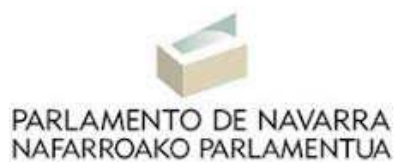
Este es el símbolo del Parlamento de Navarra