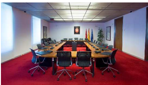
Esta es la sala de Comisiones