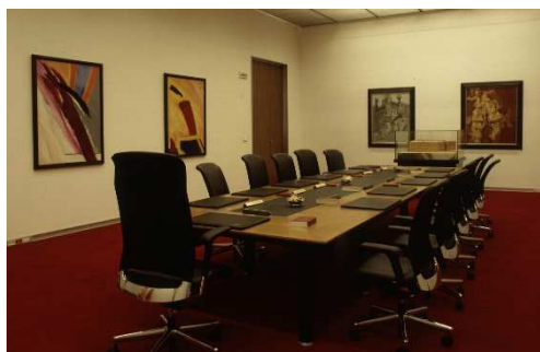
Esta es la Mesa y Sala de Juntas

Sustituye al presidente o presidenta cuando éste no está.