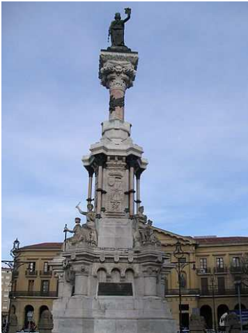
Este es el monumento a los Fueros

El Parlamento de Navarra está en Pamplona en la calle Navas de Tolosa número 1. Está muy cerca del Paseo Sarasate frente al Monumento a los Fueros.